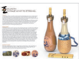
IBDA Idea_Chen Xiang-Yun