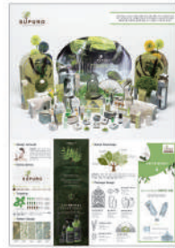
금상_IBDA Gold 피부에 자연을, SUPURO_김수민