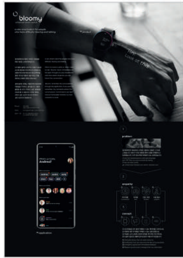
대상_IBDA Grand bloom universal smart watch_이진원