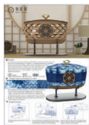
IBDA Idea_Hsu, Fang-Ping