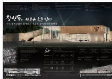
동상_IBDA Bronze 창신동, 새로운 옷을 입다_김수영