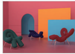
금상_IBDA Gold O.t.w_신우철