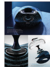
IBDA Idea_Arvin Maleki