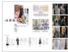
동상_IBDA Bronze ARKA_Trisha Nadira