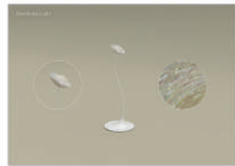
동상_IBDA Bronze Blossoming Light_한솔