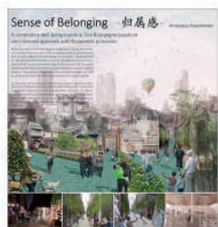
IBDA Idea_Anastasia Kravchenko