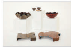
은상_IBDA Silver 다례(茶禮)_김유