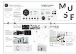
은상_IBDA Silver MUSE - Experience, Music, Perception (음악의지각)_Poon Michelle